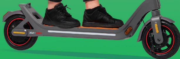
Trottinette Speedroot XM350